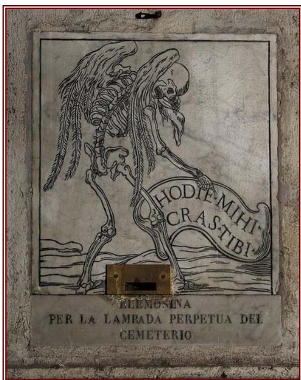
Chiesa di Santa Maria dell'Orazione e Morte, Roma

Si tratta, come si può ben comprendere, di servizi che, per il momento particolarmente delicato in cui vengono resi e per il contesto in cui sono erogati, devono saper coniugare il rispetto per le persone scomparse ed il dolore dei familiari con la necessità di dover garantire l'igiene e la salute pubblica.