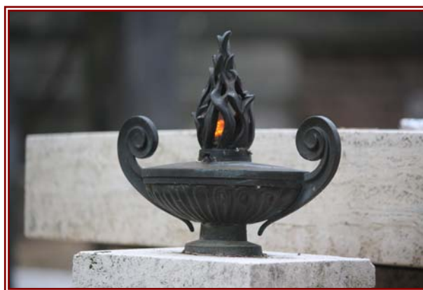
Lampada votiva presso il Cimitero Monumentale del Verano, Roma

Rispetto a questa impostazione, sostanzialmente concorde ed univoca, va però segnalata una diversa chiave interpretativa (M. Alesio, La Gazzetta degli Enti Locali, 21/1/2009 e 28/1/2009) che, partendo dalla definizione normativa di servizio pubblico locale data dal D.Lgs. 267/2000 (di seguito, TUEL) nell'articolo 112, comma 1 "gli enti locali, nell'ambito delle rispettive competenze, provvedono alla gestione dei servizi pubblici che abbiano per oggetto produzione di beni ed attività rivolte a realizzare fini sociali e a promuovere lo sviluppo economico e civile delle comunità locali" , giunge alla conclusione che difficilmente il servizio di illuminazione votiva può rientrare nell'alveo dell'illustrata nozione di servizio pubblico locale, disciplinata dall'articolo 113 del TUEL, mentre può "oscillare" dalla concessione di servizi, disciplinata dagli articoli 3 e 30 del D.Lgs. 163/2006 (Codice dei contratti pubblici), alla concessione di lavori pubblici, disciplinata dagli articoli 142-151 dello stesso Codice.