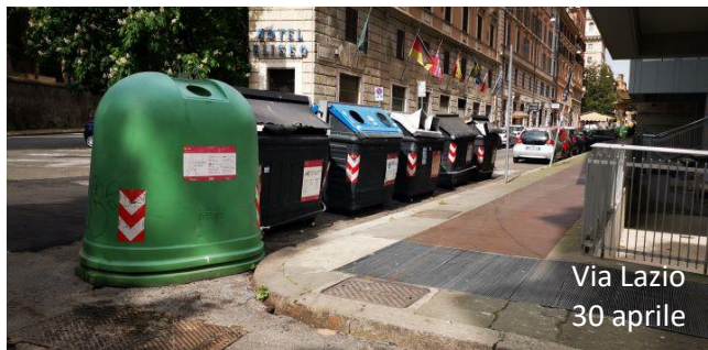
Via Lazio 30 aprile