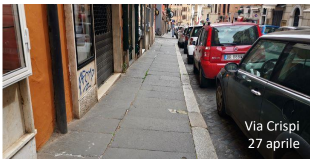
Via Crispi 27 aprile